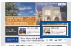
1.topページGallery 「空間から探す」をクリック

各スペースのイメージはBlueStyleホームページGalleryより カテゴリー分けされていますのでお好みの#番号をお選びください。