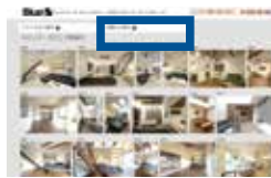
2.カテゴリーを選ぶ場合は 上記「空間から探す」をクリック